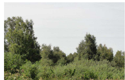
Formations riveraines de saules

(d'après « Étude relative à la délimitation et l'inventaire des zones à caractère humide en région Picardie », DREAL Picardie)