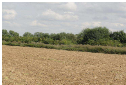
Fourrés médio-européens sur sols fertiles

(d'après « Étude relative à la délimitation et l'inventaire des zones à caractère humide en région Picardie », DREAL Picardie)